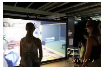
映像技術体験コーナー