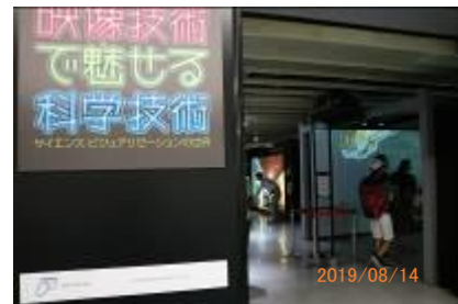
特別展会場（科学技術館2階）