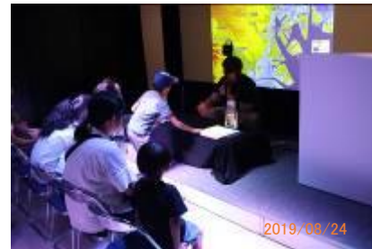
サイエンスビジュアライゼーションステージ

特別展終了後、開催期間中に行った来場者アンケートの結果を集計し、集計結果より展示の効果について分析して結果をまとめて報告書に記載した。