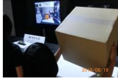
体験型展示コーナー