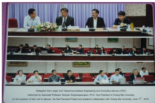
チェンマイ大学でのキックオフ会議