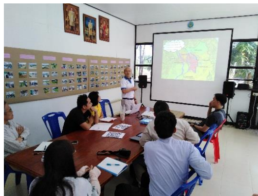
灌漑局・地方事務所