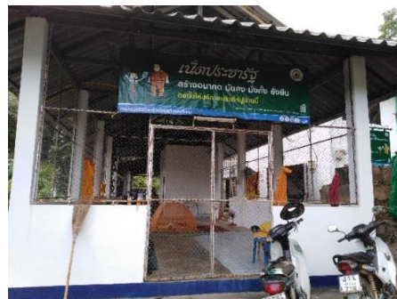
デジタル経済社会省プロジェクトサイト