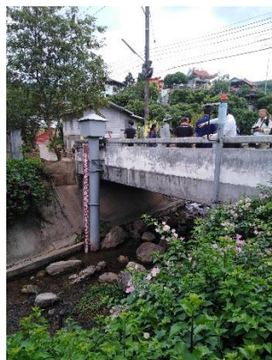
雨期に氾濫する川の水位計