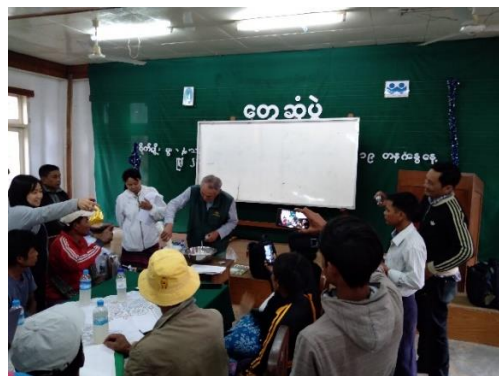
スマホの研修マニュアル活用した農業指導