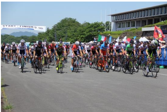
スタート時の様子

関連イベント スポーツバイク展示試乗会・周辺市町観光施設物産展 おいしいもの市・伊豆ベロドローム体験走行会、見学会 交通安全啓発コーナー・写真展、体験プログラムシールラリー