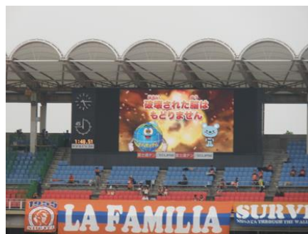
※サッカー会場での放映