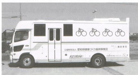
リフト付胸部X線デジタル検診車

当支部の胸部X線デジタル対応車はこれで2台目となり、さらなる検診の充実を図っていきたくと考えております。 (公益財団法人愛知県健康づくり振興事業団)