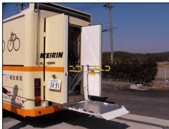
検診車後部 (車椅子用リフト)