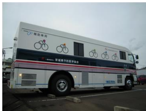
胃胸部併用X線デジタル検診車 外観