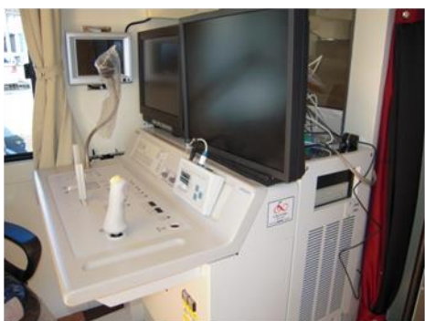
胃X線撮影装置 (操作台)