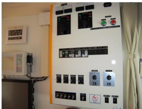
胸部 X 線撮影装置