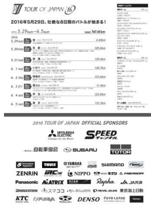
チラシ (表面)、ポスター