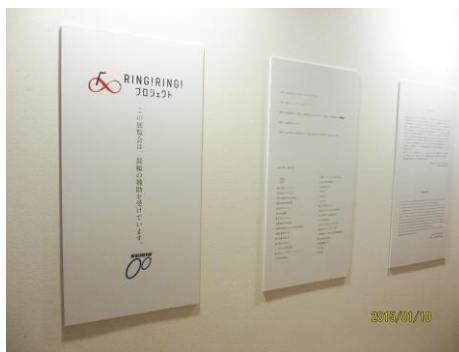
会場内 補助事業表示