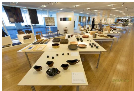
第54回日本クラフト展会場