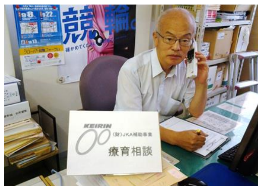
各家庭を訪問し相談を受ける相談員