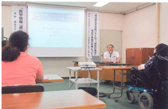
北海道支部 講演会の様子