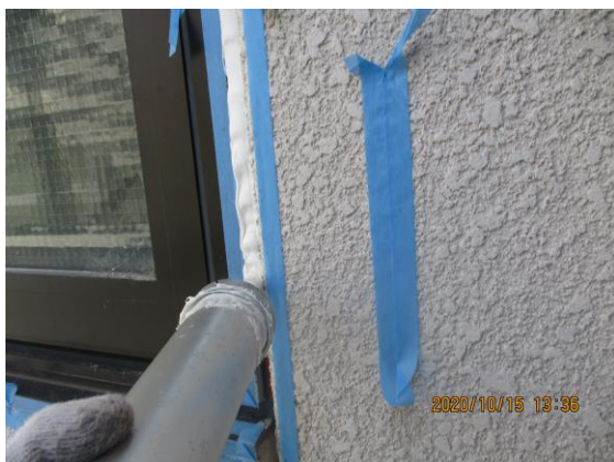
外壁補修作業の様子