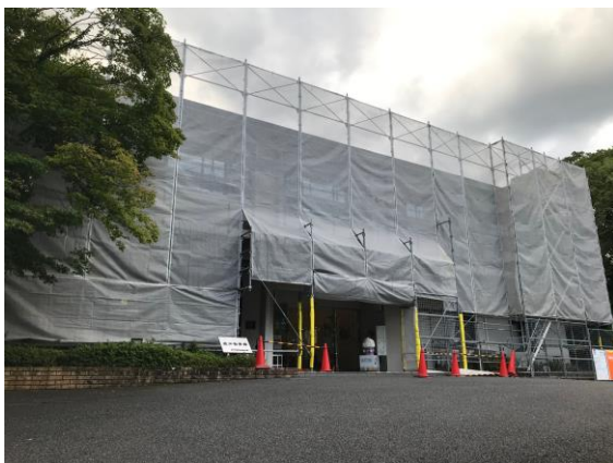
近江勸学館足場・覆いがされた様子

建物外部、外壁及び屋根、開口部の防水箇所における、経年劣化（塗装の劣化や外壁のひび割れ、防水部の劣化）に伴う塗装、シール工事補修を中心とした修繕工事。建物外部に仮設足場を設置し、外壁、屋根においては、洗浄、塗装、必要に応じて補修作業、開口部廻りの防水箇所は、シールの打替え工事の実施。