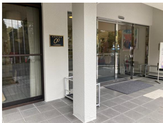
修繕後の近江勸学館（玄関）