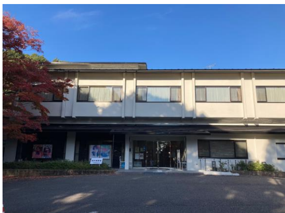
修繕後の近江勸学館