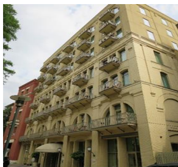
ISO/TC131 サンアントニオ会議場

また、発行されたISO審議文書116件についてすべて回答し、日本の意見の反映に努めた。