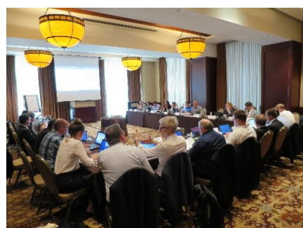
ISO/TC131 サンアントニオ会議風景