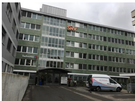
ISO/TC131 ヴィンタートゥール会議場