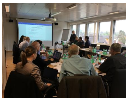
ISO/TC131 ヴィンタートゥール会議風景