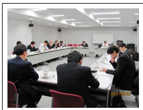
会合での検討風景

製造業のパラダイムシフトに係る内外の動きを把握するとともに、企業の認識、取組みの現状やものづくり現場での匠（TAKUMI）のデジタル化事例などの実態調査を行い、前年度示した製造業のパラダイムシフトのイメージとTAKUMI4.0の具体化の検討を行った。その結果、パラダイムシフトの全体像として“PC2Beダイナミックサイクル”とその推進役である“TAKUMI4.0”という日本の強みを活かす製造業の新しい姿を明らかにした。