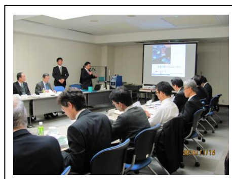
講師によるデモンストレーション風景