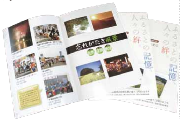
震災前の写真で編集した「思い出の場所」写真集

被災者の方たちに震災前の「ふるさとの思い出」をヒアリング調査し、その場所の写真、動画をホームページで募集して写真集として発行。お渡しした皆様からは、コミュニティ再生への思いを新たにしたりなど、有意義なコメントを頂きました。