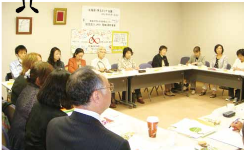
エリア会議の開催風景

チ ャイルドラインを子どもたちにとってよりよいものとしていくために、全国研修等で共有した成果や課題を各地域の現状に即して活かしていけるようにエリア会議を開催しました。