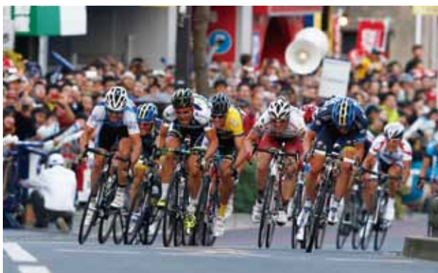
ジャパンカップクリテリウム