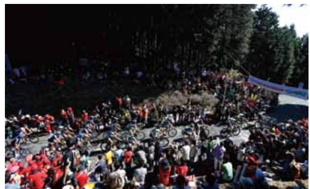
ジャパンカップサイクルロードレース

※紹介事業は一例です。その他の事例を含め詳しい情報は、 RING!RING!プロジェクトホームページに掲載しております。ぜひご覧ください。